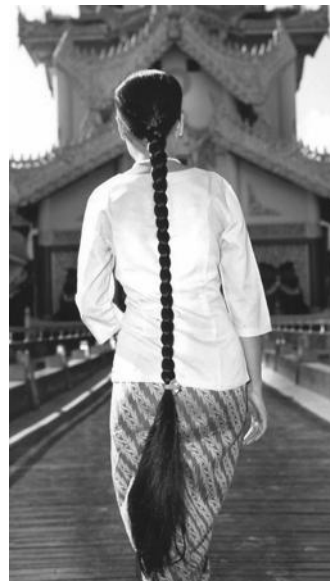
Un hommage aux habitants du Myanmar DOCUMENT REMIS

À l'issue de ce spectacle, le public a été convié au vernissage de l'exposition de photographies sur la Birmanie « Et sur ton sourire mes yeux dansaient » de Némorin (Erik Vacquier). L'artiste a investi les cimaises de la bibliothèque avec ses œuvres d'une délicate beauté, qui sont autant d'hommages aux habitants du Myanmar, « le Pays merveilleux ». Némorin a séjourné à de nombreuses reprises au Myanmar et en a rapporté des photos surprenantes et pleines de